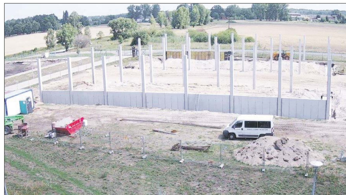
Trwają prace inwestycyjne na terenie Oczyszczalni Ścieków w Henrykowie.

W tym roku prowadzone będą prace na wieży ciśnieniowej. Przeprowadzony zostanie remont i konserwacja dachu budynku wraz z renowacją zbiornika wody, zagospodarowaniem terenu oraz częściową likwidacją dotychczasowego ogrodzenia. Pojawi się również nowa instalacja odgromowa, system monitoringu i postument informacyjny ze stali kortenowskiej. - Postawiliśmy też pierwsze inwestycyjne kroki w kierunku planowanej kompleksowej modernizacji i rozbudowy Oczyszczalni Ścieków w Henrykowie. Na chwilę obecną trwają prace przy budowie bardzo ważnego obiektu, a więc zadaszonego miejsca magazynowania osadów (dwa magazyny o łącznej powierzchni ponad 1300 m 2 ). Wartość umowy to