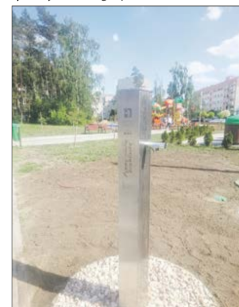
Nowe źródło - na os. Rejtana oraz przy placu zabaw "Rojberkowo" na Zatorzu.

stanu zaopatrzenia w wodę Gminy Lipno. Efektem końcowym analizy jest wskazanie priorytetów działań remontowych, modernizacyjnych oraz racjonalizujących zagadnienia hydrogeologiczne i sieciowe wraz z określeniem szacunkowych kosztów poszczególnych kierunków. Na dzień dzisiejszy zaopatrzenie w wodę mieszkańców Gminy Lipno opiera się na 8 obiektach stacji uzdatniania wody tj. stacjach w Lipnie, Maryszewicach, Radomicku, Sulejewie, Goniembicach, Żakowie, Górcie Duchownej i Klonówcu. Tylko część z tych stacji stanowi własność MPWiK. Wszystkie stacje były budowane w latach 60'tych i 70'tych. Stan techniczny budynków jak i urządzeń realizujących procesy technologiczne jest zaawansowany. Jednocześnie kontynuujemy prace modernizacyjne na obiekcie SUW Radomicko, dla którego w tym roku zakupione zostaną pompy głębinowe, śrubowa sprężarka powietrza, zbiornik sprężonego powietrza a także wymienione zostaną pompy sieciowe. Podejmowane przez Spółkę działania są niezbędne w celu zapewnienia niezawodności dostaw wody.