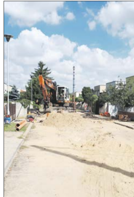
Na ul. Cybulskiego w Lesznie trwa przebudowa kanalizacji sanitarnej.

W zakresie budowy lub przebudowy sieci zakończono już działania w obrębie m.in.: ul. Ostroroga, Miodowej, Słonecznej, Wilkowickiej, Najdy, Wyszyńskiego, Andrzejewskiego, Prochownia, Szczepanowskiego oraz Zbyszka z Bogdańca w Lesznie, Krzycka Małego, a także ul. Brzechwy, Tuwima i Krasickiego w Świąciechowie. Trwają prace w ciągu ul. Lechickiej w Lesznie, a także w ciągu ul. Jodłowej, Dworcowej i Miodowej w Wilkowicach. Lada dzień ruszą prace przy ul. Świąciechowskiej w Wilkowicach, w Mórkwie oraz w rej. ul. Zaborowskiej i w ul. Diamentowej w Henrykowie. Poza tym od 2015 r. konsekwentnie wymieniany jest rurociąg tłoczny w lesie, doprowadzający wodę surową ze studni do jednej z najważniejszych Stacji Uzdatniania Wody w Strzyżewicach.