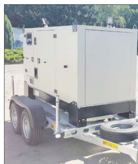
MPWiK zakupiło agregat prądowy marki Fogo.

ponad 2,4 mln zł netto. Przekazanie placu budowy nastąpiło w dniu 7 maja, a zakończenie prac przewidziane jest do połowy listopada tego roku – opisuje Rafał Zalesiński - A dlaczego w ogóle chcemy budować nowe miejsce do tymczasowego magazynowania osadów? Otóż dziś odwodnione osady ściekowe na oczyszczalni w Henrykowie składowane są na wybudowanym w 1996 r. niezadaszonym magazynie, tzw. lagunie, o powierzchni ok. 1375 m 2 . Odcieki ze składowanych przed docelowym zagospodarowaniem osadów kierowane są na początek układu technologicznego oczyszczalni ścieków. W przypadku występowania opadów deszczu osady ulegają ponownemu nawodnieniu, a opad wraz z zanieczyszczeniami zwiększa ilość odcieków ponownie docierając do oczyszczalni. Wpływa to na zwiększenie kosztów funkcjonowania