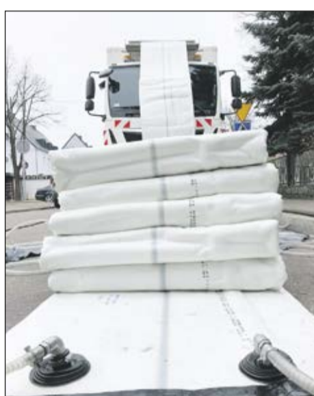
Przebudowa sieci kanalizacji ogólnospławnej w technologii bezwykopowej w ul. Andrzejewskiego w Lesznie.

Do tej pory całkowicie zmodernizowano odcinek o długości ok. 2,5 km, natomiast jeszcze w tym roku wymienione zostanie ok. 1350 metrów rurociągu. Kolejnych kilka zadań jest na etapie wyboru wykonawcy. Dotyczą m.in. ul. Kąkolewskiej, Rycerskiej, Sadowej, Dembińskiego i Sokoła w Lesznie, a także ul. Pilotów w Strzyżewicach. Inne są na etapie projektowania (np. te, które obejmują leszczyńskie Gronowo czy Zatorze).