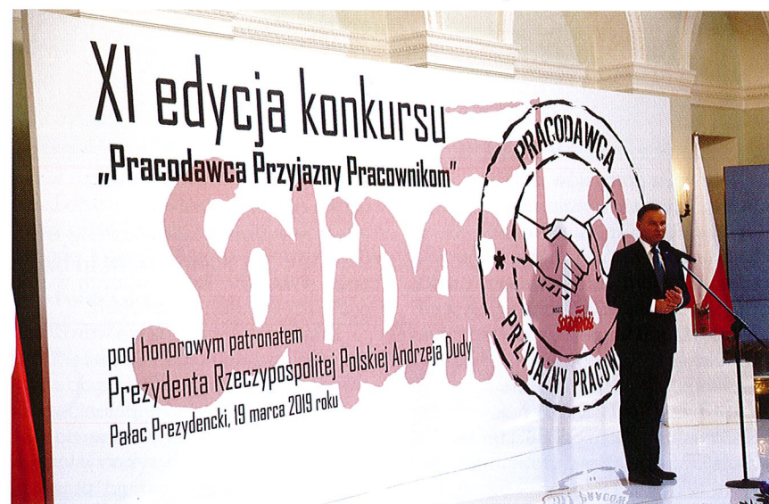
Prezydent RP Andrzej Duda

19 marca w Pałacu Prezydenckim odbyło się uroczyste zakończenie XI edycji konkursu Pracodawca Przyjazny Pracownikom. Prezydent RP Andrzej Duda podkreślał, że uczciwe traktowanie pracowników i uczciwe traktowanie pracy i pracodawcy przez pracowników ma znaczenie absolutnie fundamentalne.